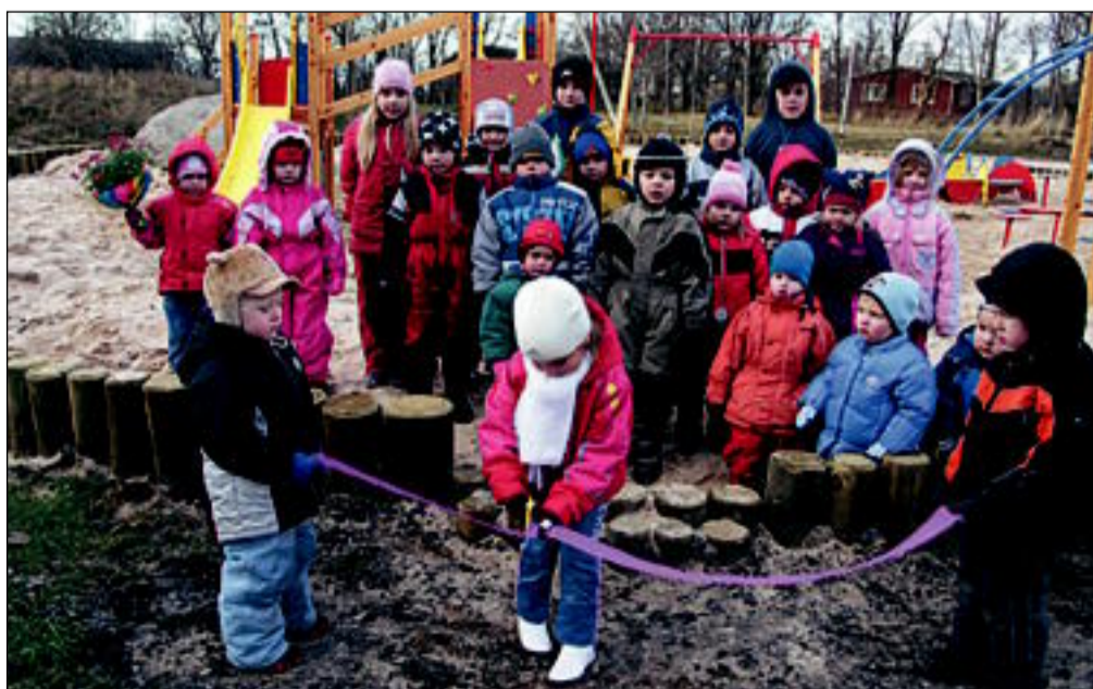
Võiste lasteaia lapsed mänguväljaku I etapi avamas

Pikka aega on Võiste lapsed ja nende vanemad oodanud mängu- ja palliväljakuid. Lõpuks on nende unistused täitumas. Valla-