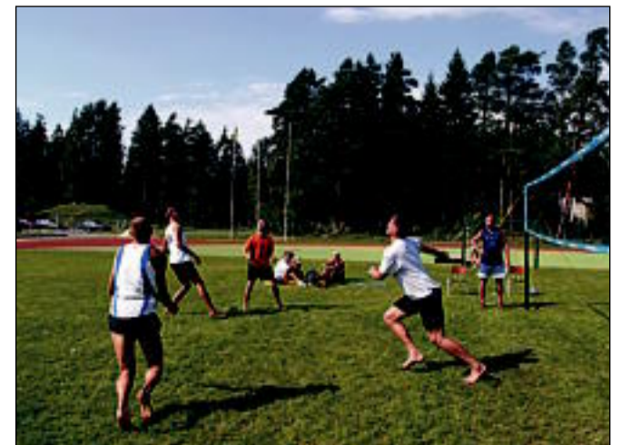
Ametit vahetanud kergejõustiklased on tublid ka pallimängus