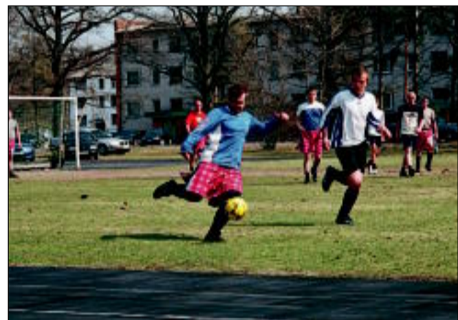
1.mai jalgpallimatš naisemehed ja poissmehed.