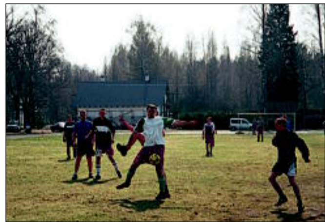
Traditsioonilisel 1.mai jalgpallimatšil naisemehed ja poissmehed olid taas edukad poissmehed. Mängu seisuks jäi 4:1.