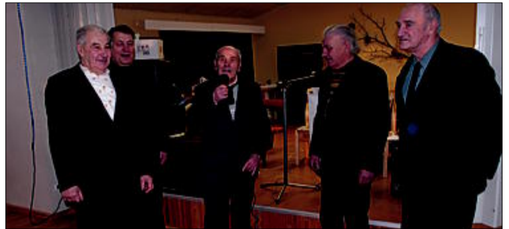
Jõuluvanale salmi lugemas ja laulmas kohapeal moodustunud meesansambel.