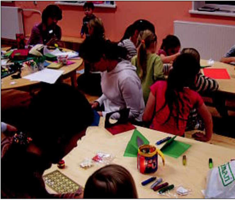
12.–13. detsembril meisterdas Uulu lasteaia pere ühiselt jõulukaunistusi.

Tahkuranna valla eakate jõulupidu toimus 2005. aasta 28. detsembril Tahkuranna kooli saalis.