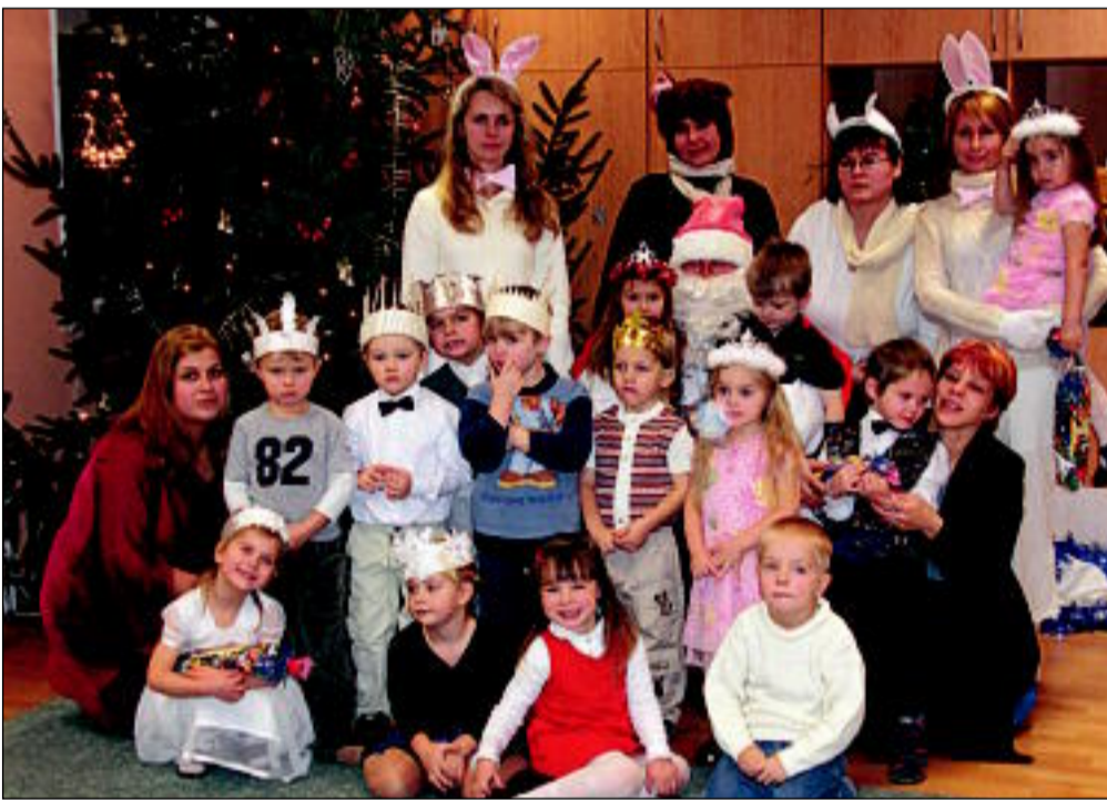
21. detsembril toimusid jõulupeod kõigis lasteaia rühmades, kus kõige oodatium mees oli Jõuluvana.