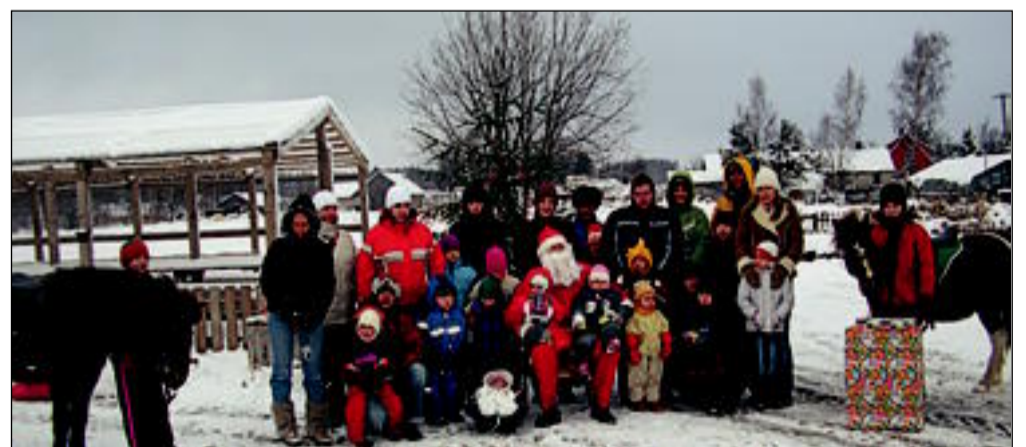
Lepakülas on saanud kauniks traditsiooniks jõululaupäeval perede kogunemine külaplatsile, kuhu tuleb jõuluvana, kes toob kingitusi perede väiksematele liikmetele. Nii oli see ka 2005. aasta 24. detsembril.

Võiste Põnnikooli lapsed koos eelkoolialiste koduste lastega jõulupeol.