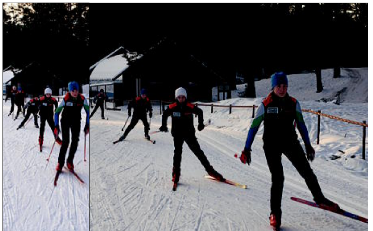
Kodused Jõulumäe suusarajad on parim paik treeninguteks.