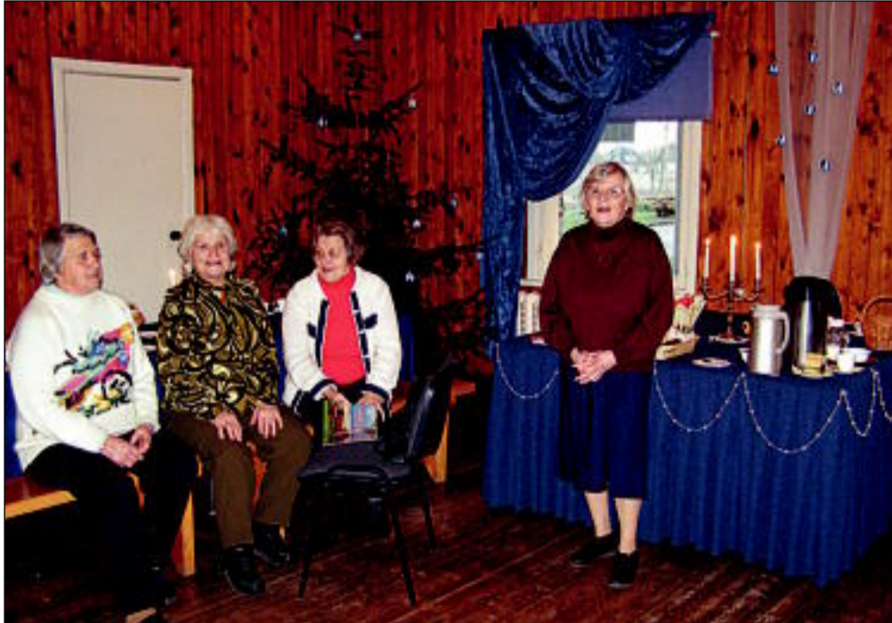
Tahkuranna küla elanikud jõulu ümarlaul 18. detsembril 2006

MTÜ "Tahkurandlane" sai hoogu õnnestunud külapäevast, tänu külarahva aktiivsest kaasalöömisest ja otsustas jätkata kokkusaamisi. Nimetame seda küla ümarlauaks. Kokku tuleks küla rahvas Tackendorfi puhkemajja. Istuksime, ajaksime juttu – räägiks-kuulaks küla ja valla uudiseid, arutaks küla elu paremaks muumist (seda saab ju alati). Kutsuksime kohtuma ka neid, kellel meile midagi huvitavat öelda või näidata. Et laual oleks ka midagi näksida – selle eest hoolitsevad osalejad ise, sest "tasuta lõunaid" ei ole olemas. 18.detsembril 2006 aas-