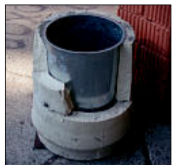
Rae bussipeatuse lõhutud prügikast kas on ikka vaja koristada seda bussipeatust, kui ollakse vastu?