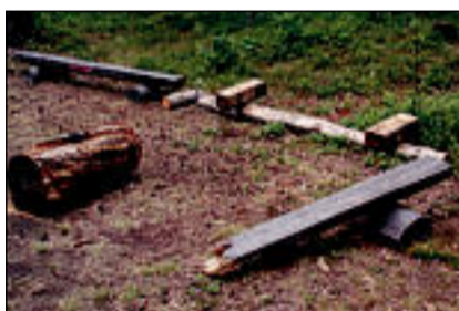
Loodusraja pingid – Ei ole meile vaja ka mingit loodusõppe rada.