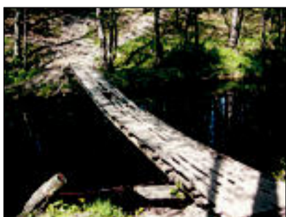
Sild üle Uulu kanali 23. mail ja 4. juulil. Lõhuks korra lõhuks kaks, sillakene katki praks. Parem on ju ujuda üle jõe kui minna kuiva jalaga