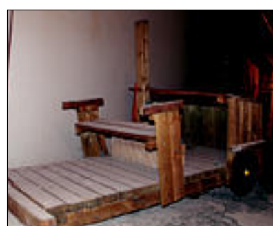
Auto – lõhkujate vanemad! Ootame tegusid või rahakoti kergendamist.