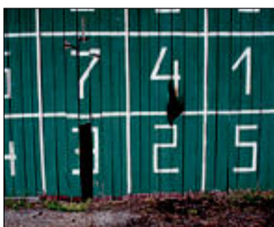
Uulu staadionil üritati põlema panna jalgpalli täpsuslöögi ala. Äkki meile polegi seda vaja?