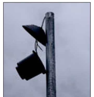
Lamp – Ehk elaks pimedas!