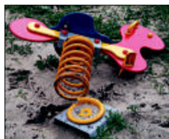
Kiik – Kas lasteaia lastele on vaja mänguväljakut?