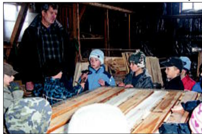
Uulu lasteaia pere