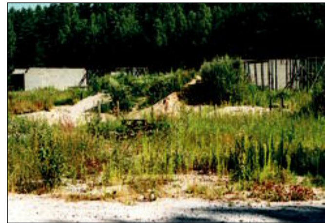
Vaatoreostus Laadi külas

Milleks siis üldse maale tulla elama? Kui oleks minu teha, siis ma suurendaks seda piirmäära veelgi sõltuvalt asukohast. Kõige absurdsem kinnisvaraarendajate etteheide, mida ma olen kuulnud, on – meil ei lasta riigitee äärde põllule maju ehitada, keskkond on põllupidamiseks seal nagunii liiga mürgine. Lagedale põllule ilma igasuguse haljastuseta elurajooni planeerimine on küll asi, mis ei allu inimloogikale ja ülemaailmsetele üldtunnustatud headele ehitustavadele. Veel – teadvustagem endale mõisted: mura-reostus (valdavalt maantee-müra), valgusreostus (autotuled öösi), vaatoreostus (aknast paistvad varemed või naabri praht, samuti maha jäetud naaberkrundil kasvav