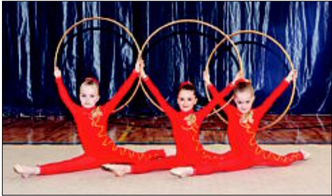
Meie valla 3 tublit võimlejat

Eelmises valla lehes lubasime teid oma tegemistega kursis hoida. Käisime 17. aprillil Elva lahtistel meistri- võistlustel ja saavutasime rõngakavaga I koha. 26. aprillil toimus Kilingi-Nõmme paarisvõistlus ja spa- kaadivõistlus, ka sealt saime endale medalid kaela. Sellel aastal rohkem võistlusi ei tule, küll aga esineme veel päris mitmes kohas. Oma valla rahvas saab pisikesi võimlejaid näha 1. juunil, lastekaitsepäeval, vallamaja ees platsil. Kellel huvi on,