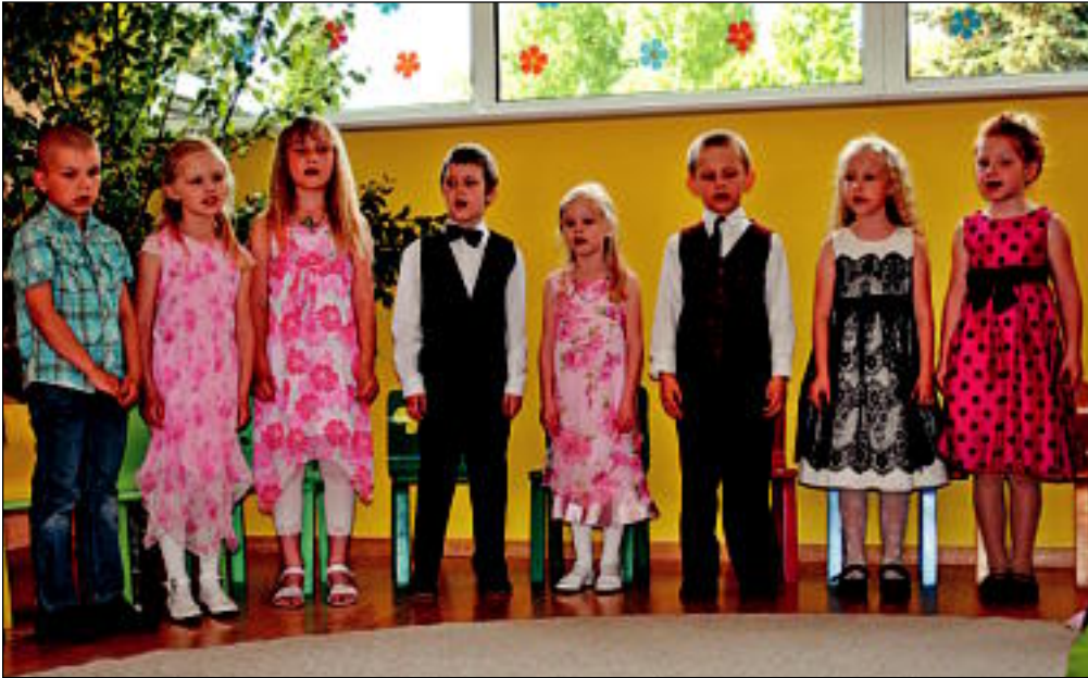
Võiste lasteaia lõpetajad.